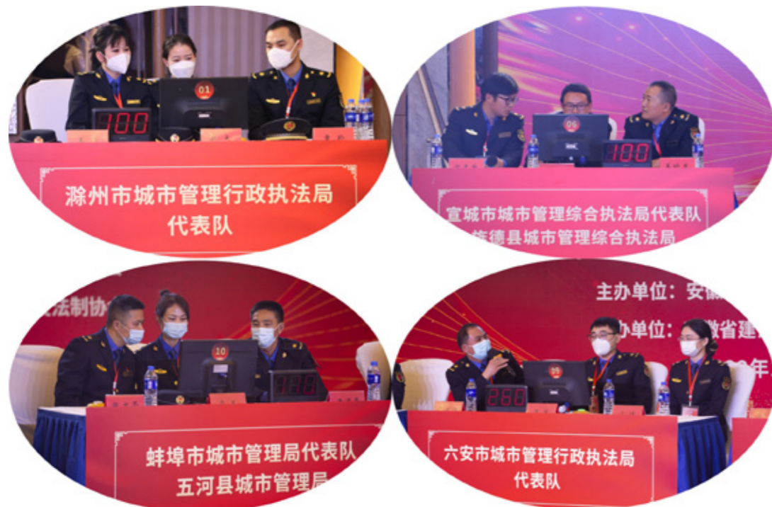
(城管组代表队风采)