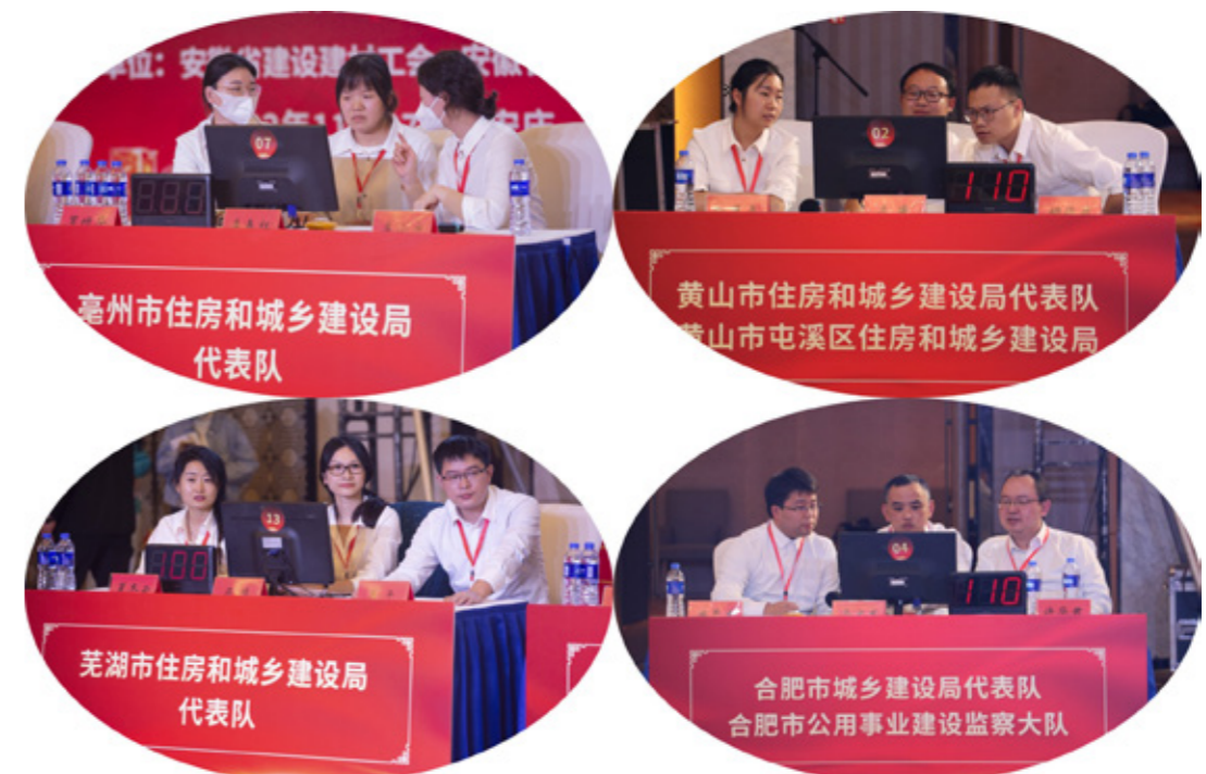
（住建组代表队风采）